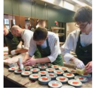
Es wird angerichtet